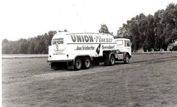
En af Union Bryggeriernes øl-tankvogne

Konkurrencen var sponsoreret af Union Bryggerierne i Dortmund hvilket betød, at der rundt om springgraven, var øl-barer der fik leveret øllet i tykke slanger fra 4-5 øl-tankvogne der stod i en cirkel om hele pladsen.