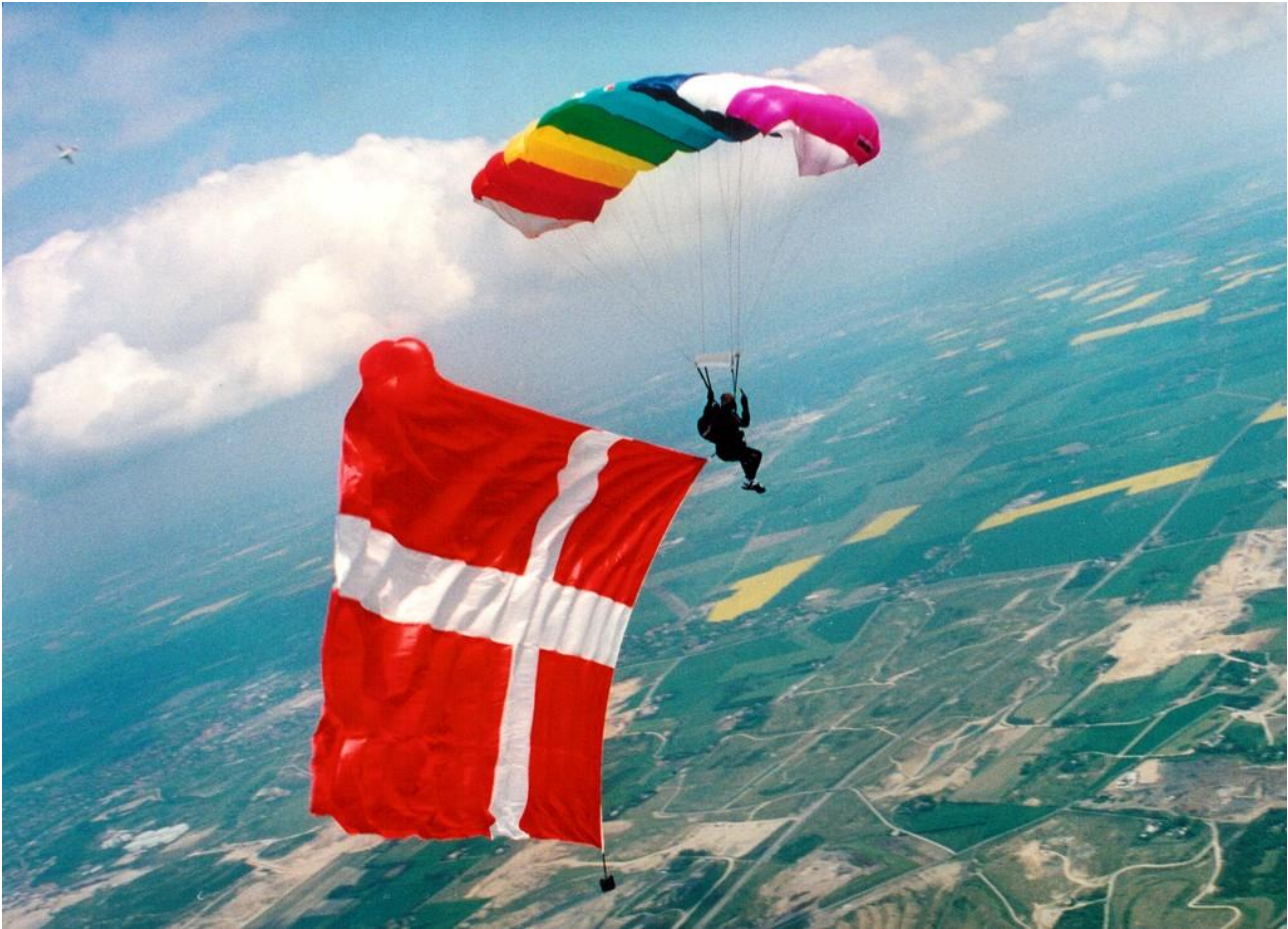
Dannebrog på 50 m 2