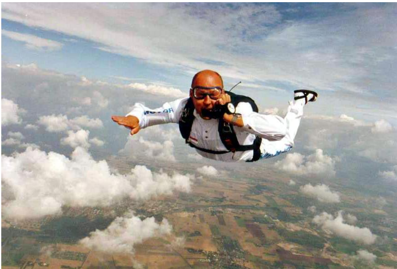
Hallo hallo det er Motorola Skydiving Team – vi er der om et øjeblik!