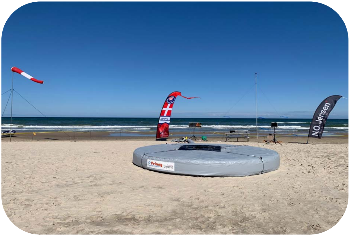
Billede taget under Blokhus Beach Accuracy Competition 2019

LØRDAG D. 14. MARTS 2020 KL. 10.00 – 15.00