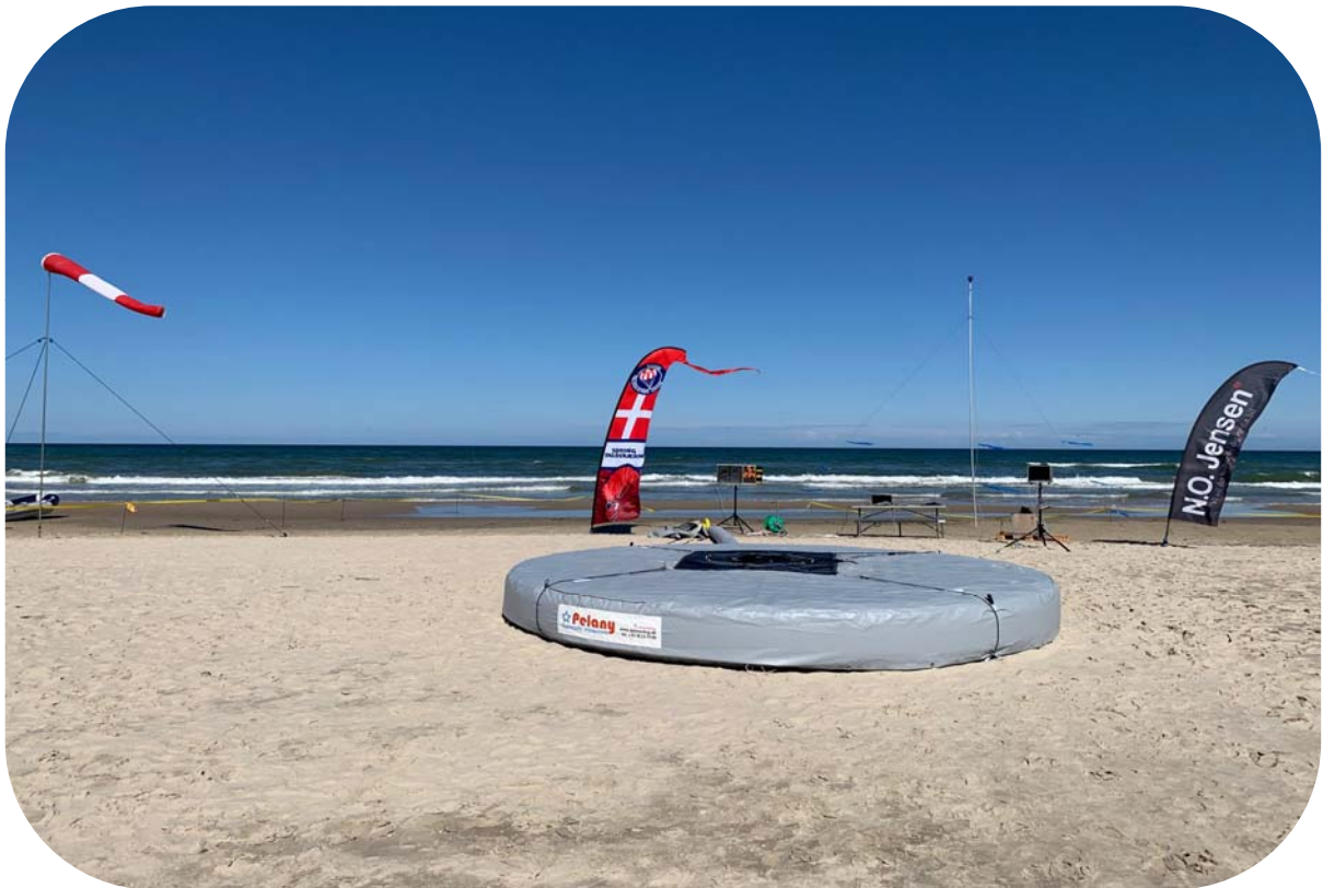
Billede taget under Blokhus Beach Accuracy Competition 2019

LØRDAG D. 14. MARTS 2020 KL. 10.00 – 15.00